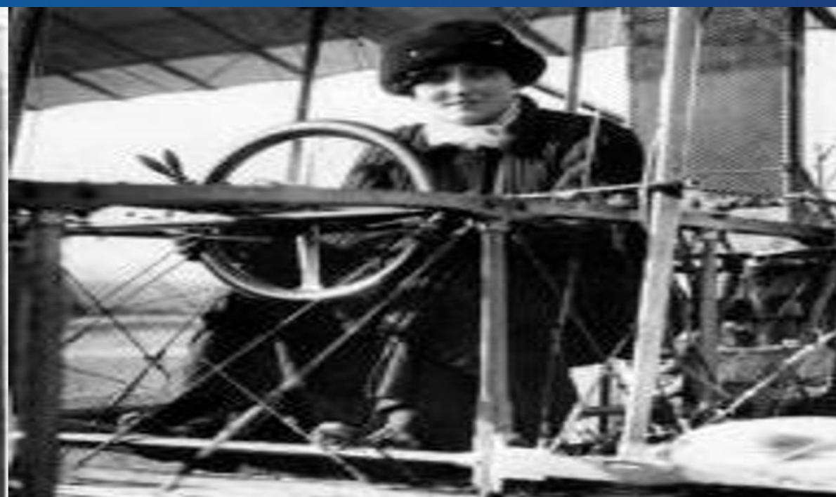
Elise Raymond Deroche